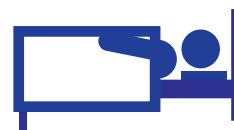
寝たきりのリスク増